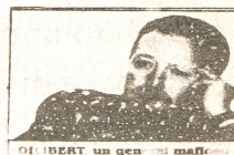
OLIBERT un general matón