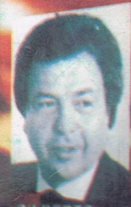
GILBERTO RODRÍGUEZ OREJUELA