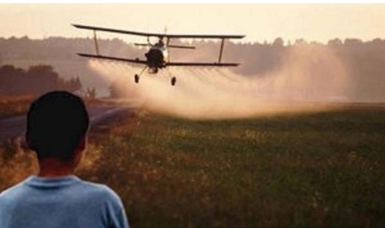
Fotografía tomada en Paraguay.

Más del 86% de los cultivos transgénicos en el mundo se cultivan en Norte y Sudamérica. El principal impulsor del crecimiento generalizado de los cultivos transgénicos en América del Sur ha sido el uso de soja tolerante al glifosato (o Roundup Ready), que es ahora plantada en más de 55 millones de hectáreas. En 2014 Brasil y Argentina fueron los principales productores de soja RR de América del Sur, con 29 millones y 20,8 millones de hectáreas plantadas, respectivamente. En Argentina esta área ha aumentado en más del doble desde el cambio de siglo, mientras que en Brasil el área de soja RR se ha incrementado en un 778% en el mismo período. 7